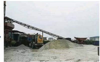
執法隊原本只取締一家偷水工廠，却意外发现毗鄰兩間工廠也在偷水，包括資源回收廠、石灰工廠及水槽製造廠。

雪州水供管理公司會繼續打擊非法接駁水管的勾當，包括不定期展開巡視和調查工作，避免蒙受虧損。