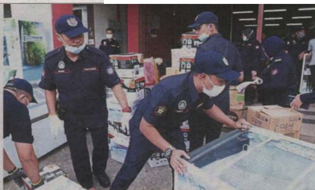
MBSA enforcement officers carting away seized items from one of the two premises raided.

Shahrin reminded all trade licence holders in the city to run their own businesses