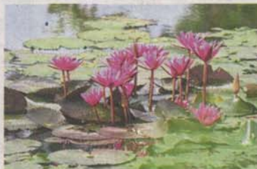
Water lilies are one of the attractions at the community farm in Section 8, Shah Alam.

further, residents use drain water to water the plants.