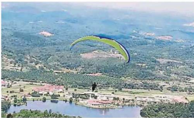
除了万津的朱格拉山，新古毛也有进行滑翔伞运动的地方。

此外，该局也欢迎拥有优质旅游产品的酒店或旅行社等相关行业的业者与他们联系，寻找合适的推广方案，甚至参与线上旅游展、商户访问等。