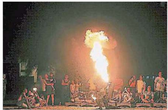
精彩的沙滩火舞秀在雪州也能看到！（档案照）

鉴于政府目前仍禁止大型群聚活动，所以雪州旅游局旗下的日本盆舞节（Bon Odori）和雪兰莪国际原住民艺术节等常年活动，今年已被迫取消，但雪州旅游局也会探讨符合标准作业程序的替代活动。