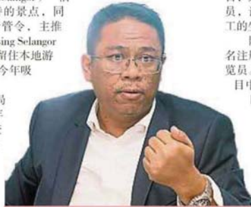
阿茲魯：雪州旅游局配合复原期行管令推出“先环游雪州”活动，欢迎本地游客深入发掘雪州之美。

据大马统计局近日公布的2019年大马国内旅游调查报告，雪州是最多国内游客旅游的地方，去年共有3360万人次到访；我国首都吉隆坡则以2260万人次居次。