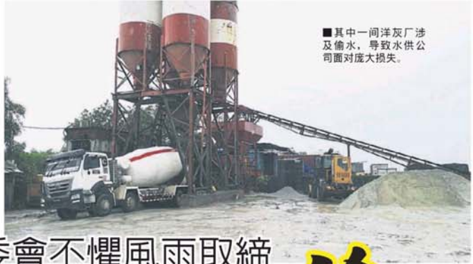
■其中一间洋灰厂涉及偷水，导致水供公司面对庞大损失。