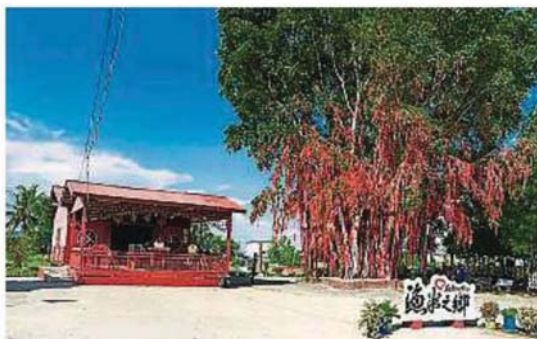
有稻有海的鱼米之乡连耕庄，向来最受本地游客青睐。