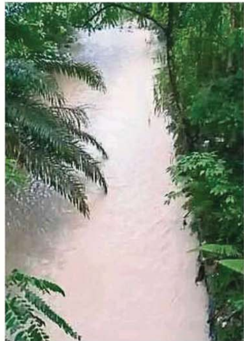
原本清澈见底的万撓河遭居民投报已变色。

“身为本区人民代议士，我对工业污染的容忍度很低，因为居民的健康和生命是远较商厂的金钱利益更为重要的。在未来我将继续严厉监督本区的工业污染问题，守护万撓。”