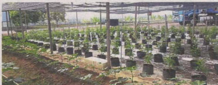
An array of vegetables planted in the Taman Mewah community farm in Yong Peng, Johor. The farm emerged second runner-up in the competition.

City Council (MBSA) for approval. "In 2014, we received the green light from the city council who also helped us to level the land. "This is the pioneer urban community farm in Shah Alam which has also become the role model for residents of other zones under MBSA's jurisdiction, inspiring them to start their own community farm," he said, adding that there were more than 20 urban farms now under the city council's jurisdiction.