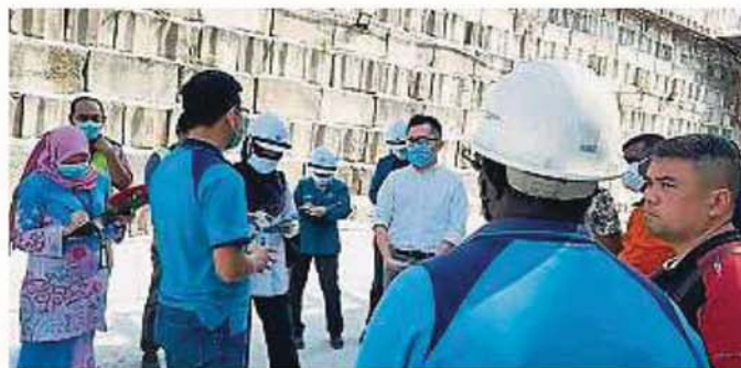
各局官员在交换审查结果后，同意给予厂商7天的时间改善状况。