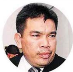
阿都拉萨慕沙将出任律政司。

(吉隆坡 9 日讯) 10 年前在赵明福验尸庭审讯中发表不当指控而被抨击的反贪污委员会律师阿都拉萨慕沙，受委为律政司。