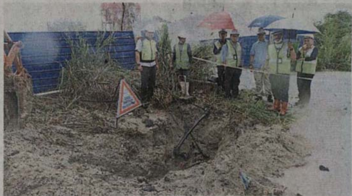
■雪州水务管理公司和国家水务委员会取缔偷水行动时，发现3家工厂业者非法接驳水源。

(巴生9日讯) 雪州水务管理公司和国家水务委员会原本只取缔一家涉嫌偷水的工厂，却意外发现毗邻两间工厂也在偷水，而且估计偷水活动已1年，因此直接切断3家工厂的水源，并通过发出警告信，命令他们在14天内还清所拖欠的水费。