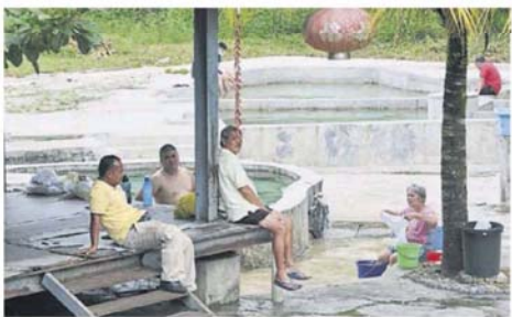
■士拉央热水湖是许多民众热爱前来泡温泉的地方，因此许多民众听闻“开放”消息后都纷纷前来。

自实施行动管制令，市议会已关闭该热水湖，直至今不曾开放，惟在上周六开始有不法之徒擅自“开放”热水湖，向到访居民徵收2至4令吉的泊车费。