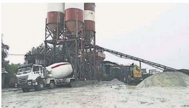
其中一厂涉及偷水，导致水供公司面对庞大损失。