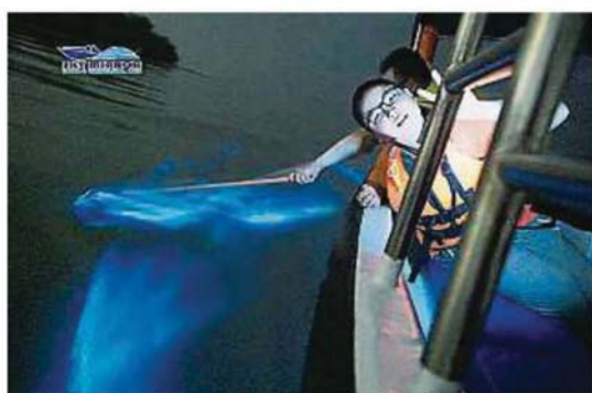
瓜雪的“蓝眼泪”也是近年大火的景点之一。(档案照)