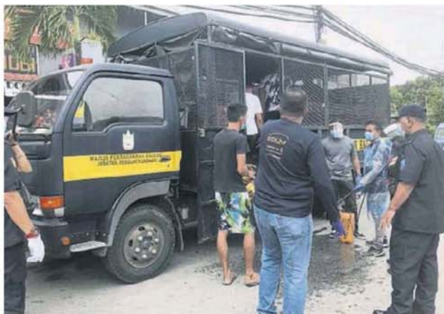
■没有合法证件的外劳全部带上市议会执法组的罗厘。

加影市议会在今次行动中出动100名执法员展开执法，布城移民局则有30人参与行动。