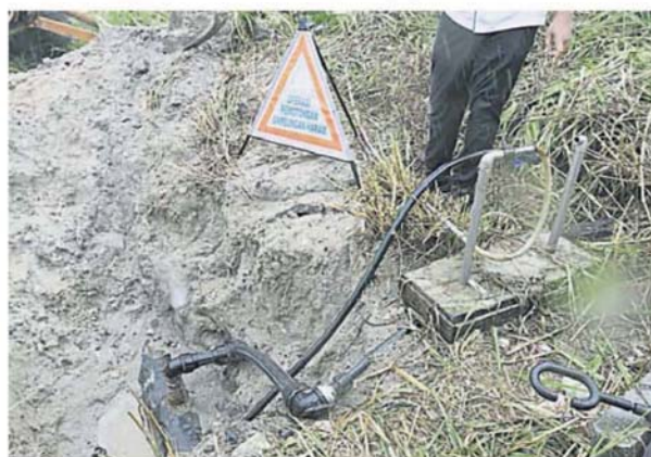
工厂利用25厘米和32厘米直径的小水管，从地下大水管钻洞，非法驳接生水至工厂使用。

欢迎民众举报偷水活动，一旦发现所在地区水压突然偏低，极有可能是因为偷水而出现了不寻常的用水量，电话：03-8317 9333 或电邮：aduan@span.gov.my，以找出原因。