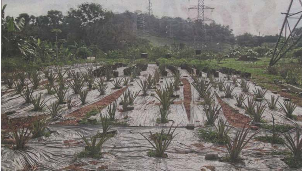
Tasik Teratai 8 Timur Community Farm in Shah Alam occupies land located on a hillslope near TNB pylons.

Provided for client's internal research purposes only. May not be further copied, distributed, sold or published in any form without the prior consent of the copyright owner.