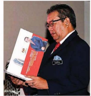
阿都拉迪: 4 个非国盟政府执政的州属, 会成立联邦乡委会。

“但是乡委会及联邦乡委会依然可以使用部门及属下机构, 提供的拨款执行各项活动。” #