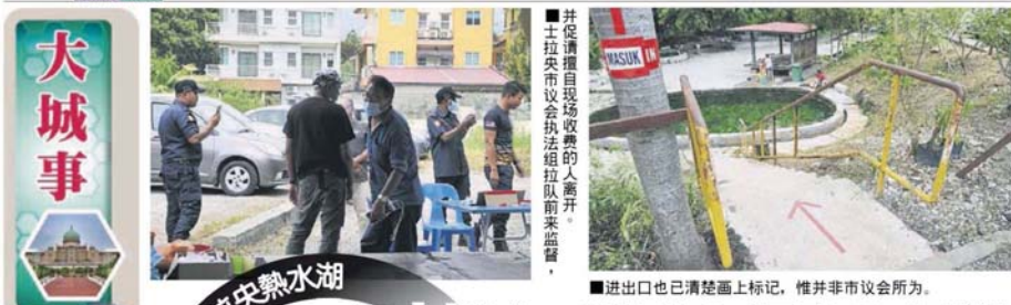
■并促请擅自现场收费的人离开。 ■士拉央市议会执法组拉队前来监督。

Provided for client's internal research purposes only. May not be further copied, distributed, sold or published in any form without the prior consent of the copyright owner.