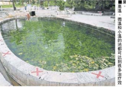
■高温、微温和小温的池都可达到很多治疗效果

他指出，为了避免新冠肺炎爆发，士拉央热水湖现阶段必须关闭，否则一旦爆发确诊病例，士拉央市议会就会遭殃而必须负起责任。