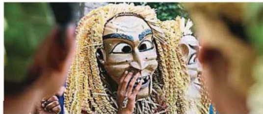
快趁着复原期行管令走一趟加厘岛 (Pulau Carey)，认识玛美里 (Mah Meri) 族的文化。

经历了长达3个月的行管令与有条件行管令，随着政府允许本地旅游，国内许多旅游景点已逐渐恢复“人气”，而雪州旅游局在这期间也没有闲下来，甚至陆续筹划了一些活动、计划，准备重整雪州旅游业。