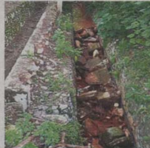
Debris from a broken kerb has clogged the drain along Jalan Cheras Perdana.

"It has been 20 to 30 years since the drain and roads were improved.