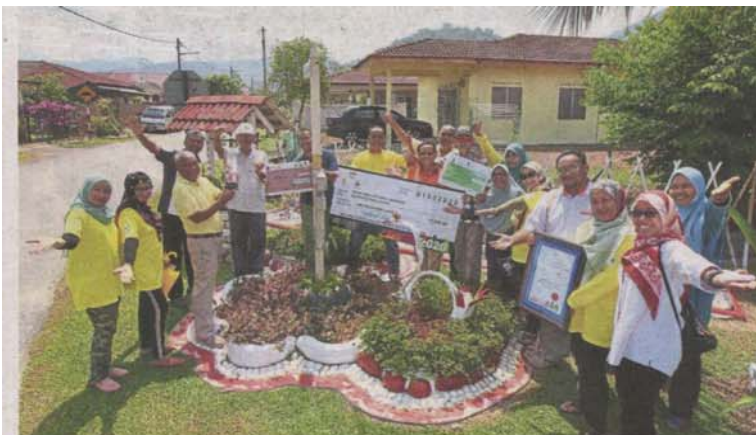
Desa Anggerik residents with the mock cheque of RM15,000 that they won in the landscape competition.

Provided for client's internal research purposes only. May not be further copied, distributed, sold or published in any form without the prior consent of the copyright owner.