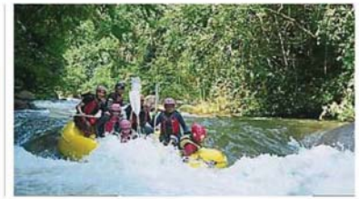
想尝试“激流划艇”？不用跨州，在乌鲁雪兰莪就能找到！