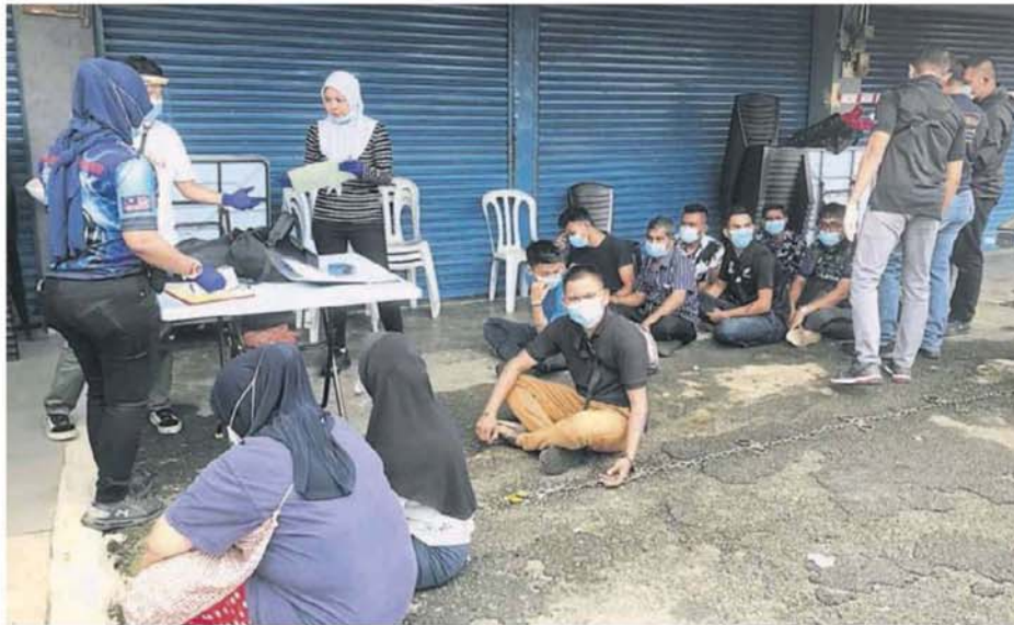
■外劳被集中在在一间商店前等候发落。

Provided for client's internal research purposes only. May not be further copied, distributed, sold or published in any form without the prior consent of the copyright owner.