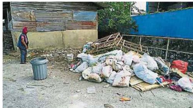
沦为非法垃圾岗。 万撓新村10路防洪沟旁的空地,