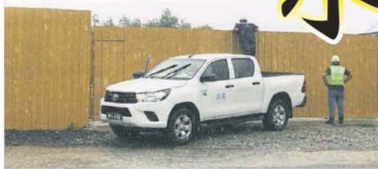
■执法人员不惧豪雨，在雨中继续执法，并隔墙高喊厂内负责人出来。

他说，起初是接获一间洋灰厂偷水，但经过进一步调查后，发现毗邻2间工厂，即资源回收厂和水槽制造厂，也一起偷水。